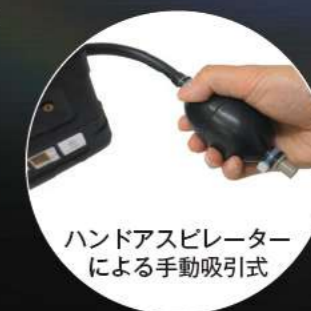
ハンドアスピレーター による手動吸引式