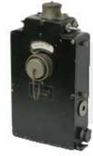
理研ガス検定器3型 (1930年開発)