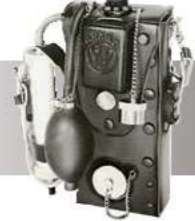
理研ガス検定器18型 (1952年開発)