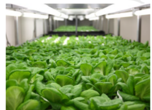
< 植物栽培施設 >