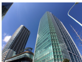
< オフィスビル >