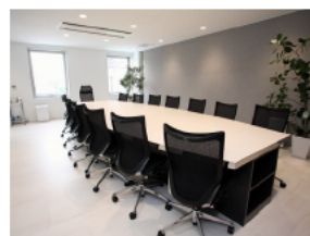
< 会議室 >