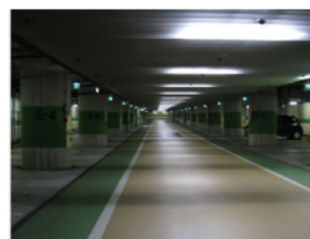
< 地下駐車場 >